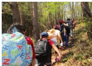
休憩をしながら安波山〇×クイズ！答えは頂上で♪

4月21日(土)、暑いくらいに晴れ晴れとした天気のなか「安波山」へ！普段なかなか歩かない鹿折駒米沢側の登山道から登りました。