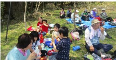
種まき桜は葉桜でしたが、みんなで食べるフカヒレスープはとっても美味しい♪

◇ 長期連休は最近歩 ◇ き出連休は最近歩 ◇ 公園めぐりでもと ◇ 草をちぎってみた ◇ たり、石をさわって ◇ 目をみたり、遠くを ◇ 初め入るもの(休憩 ◇ あしがでくられたか ◇ 何よりお金がかか ◇ 係母は嬉しいよ