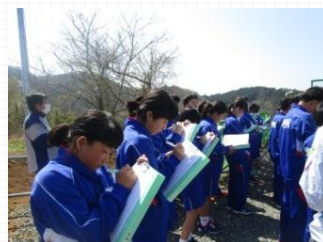
熱心に説明に耳を傾けてメモ！