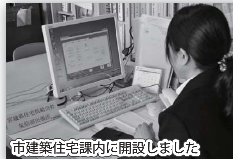
市建築住宅課内に開設しました