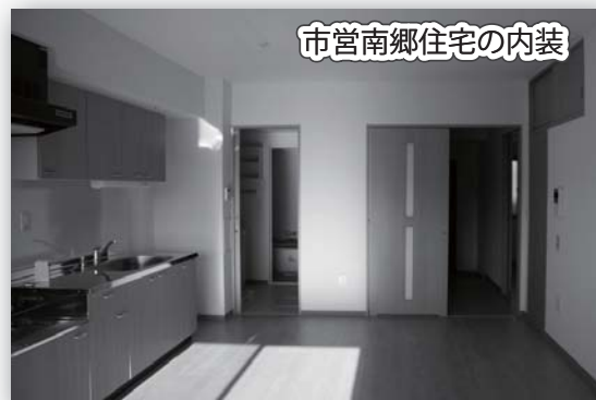
市営南郷住宅の内装