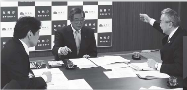
竹下復興大臣(中央)に市の状況と要望を伝えました