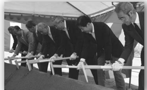
工事の安全と早期完成を願い「鍬入れ」

同地区の共同化事業は、1階を店舗や事務所、2～6階を災害公営住宅や地権者住宅とするほか、集会所や高齢者福祉施設、浜見山への避難経路も整備され、平成28年7月の完成を予定しています。