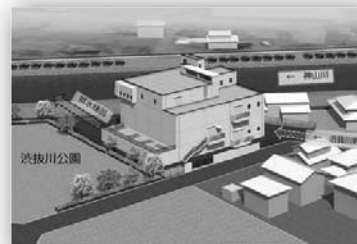
南郷雨水ポンプ場完成イメージ

工事期間中は、騒音、振動や交通規制など付近住民の方や通行される方にご迷惑をおかけしますが、工事に対するご理解とご協力をお願いします。