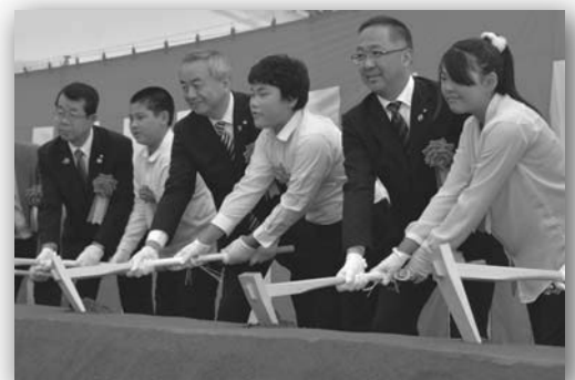
小原木小学校児童も一緒に鍬入れ

・三陸道・大島架橋・唐桑最短路・本吉バイパス 整備促進課 tel:22-6600 内線566