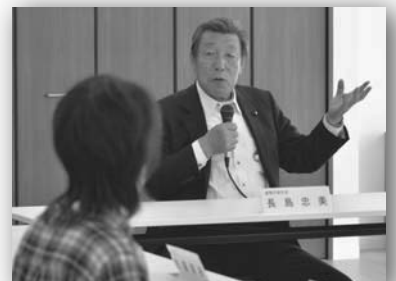
住宅入居者と懇談する長島副大臣