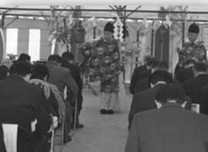
関係者が工事の安全を祈願

また、建物上屋を利用し訓練が行えるように整備し、来年 3 月の完成を予定しています。