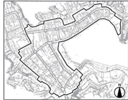
縦覧対象地区(魚町・南町)