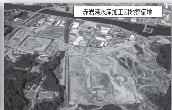
赤岩港水産加工団地整備地