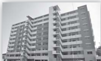
完成した市営四反田住宅