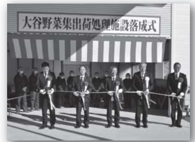
落成を祝いテープカット

大谷地区では 28.9 ヘクタールのうち、今年度に引き渡された約2ヘクタールの畑で、新たにネギ栽培に取り組み始め、4月末から定植したネギが、初収穫を迎えました。収穫されたネギは「南三陸ねぎ」として、流通される予定です。