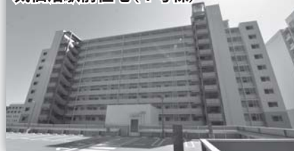
気仙沼駅前住宅(1号棟)