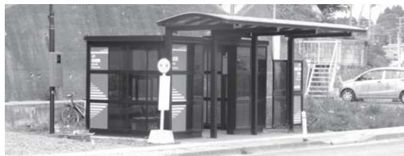
▲ 待合室・上屋の例（松岩駅）