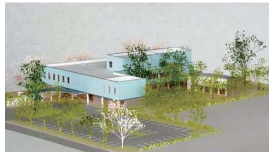
※現在の完成イメージ図です。今後変更する場合があります。

■問い合わせ先 / ・生涯学習課 tel : 22-3442 ・子ども家庭課 tel : 22-6600 内線442