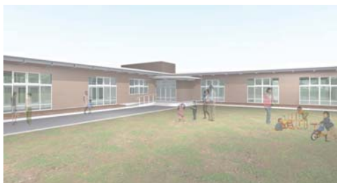
※現在の完成イメージ図です。今後変更する場合があります。

※「認定こども園」とは、幼稚園と保育所の機能を持ち、教育・保育を一体的に行う施設です。