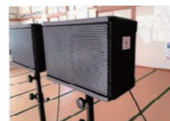
スピーカーセット