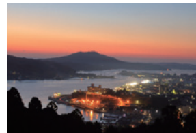
平成29年度金賞作品「夜明け」