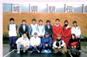
▲宮城県駅伝競走大会に出場

交通安全祈願元旦マラソン、気仙沼つばきマラソンはじめ各種市民マラソン大会へ参加しています。大船渡駅伝や、月立駅伝にも参加することもあります。