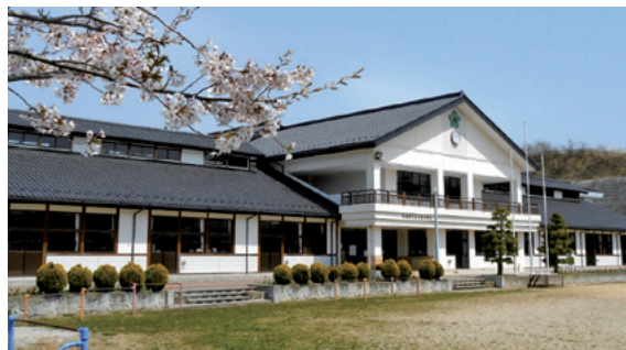
3月末で閉校する水梨小学校 校舎（物倉山6）

少子化により児童数が減少したことから、水梨小学校を閉校し、4月からは松岩小学校と統合します。閉校にあたり、閉校式を行います。卒業生、地域の皆さんも参加できますので、ぜひ来校ください。