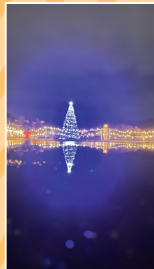
『海上ツリー』 【12月17日 月下美人さん】