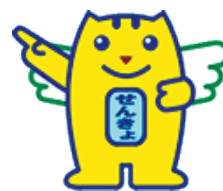
明るい選挙キャラクター 「選挙のめいすいくん」