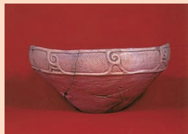
南最知遺跡より出土した縄文土器

南最知遺跡周辺には、縄文時代から中世までの遺跡が複数あり、長期間にわたって人々が暮らしていた地域であることがうかがえます。