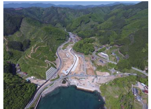
〔上空から見た只越バイパス〕