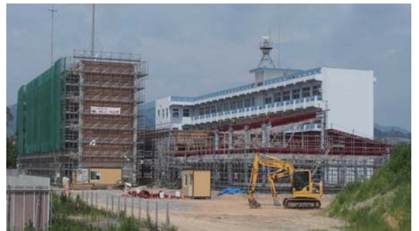
①整備が進む「震災遺構」・「(仮称)震災伝承館」と「岩井崎プロムナードセンター」の合築施設(7月下旬撮影)

震災遺構保存整備工事は現在、コンクリートの劣化防止作業、見学ルートの整備、エレベーターの設置工事を行っています。また、震災伝承館とプロムナードセンターの整備は、基礎工事が完了し、鉄骨の組み立て工事を行っています。これらの施設は、平成31年3月のオープンを目指しています。