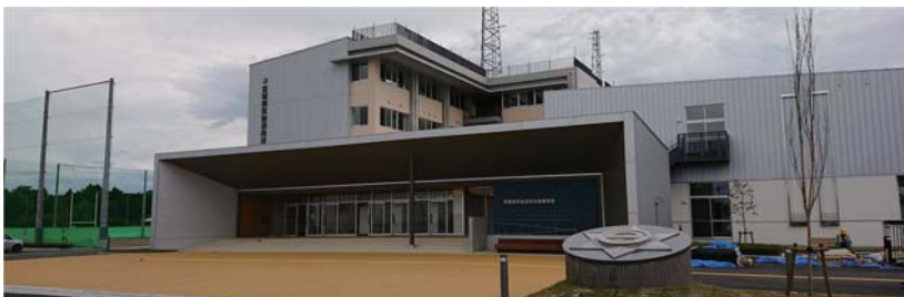
②気仙沼向洋高校新校舎