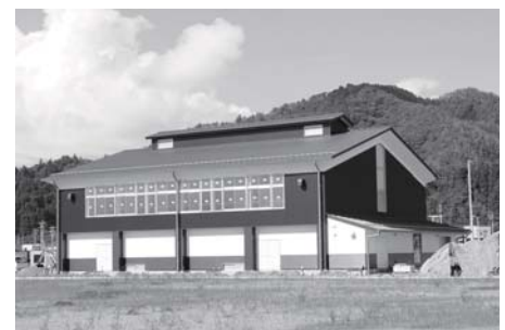
①(仮称)鹿折地区コミュニティセンター(鹿折公民館)(9月撮影)