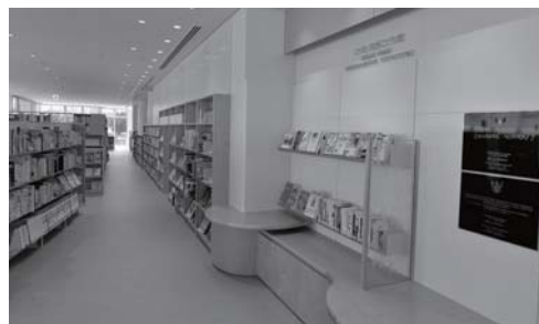
④ 気仙沼図書館内 児童図書エリア

平成23年6月に当時のユドヨノ大統領が本市を訪問し、市内被災者を激励したほか、200万ドルの寄付をいただきました。寄付金は気仙沼図書館の建設費の一部として活用し、館内児童図書エリアは「ユドヨノ友好こども館」と命名され、震災復興支援の象徴となっています。