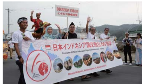
④ 今年のみなとまつり パレードの様子