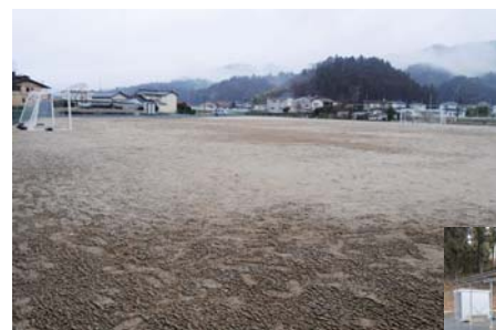
▲新しい仮設グラウンド

新たな仮設グラウンドの面積は約5千㎡で、器具庫や仮設トイレを設置。生徒が移動する際にはバスを利用し、体育の授業や部活動に使用しています。