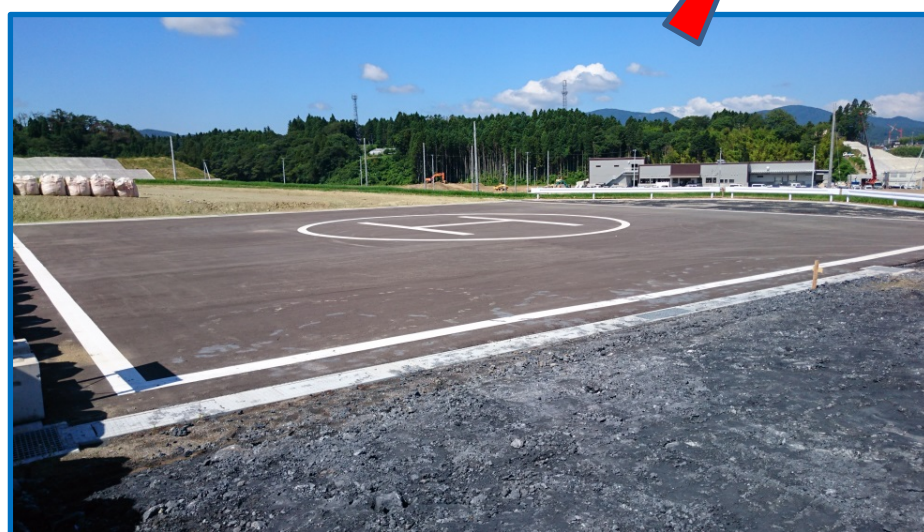
■無人航空機 （ドローン） 操縦訓練会場