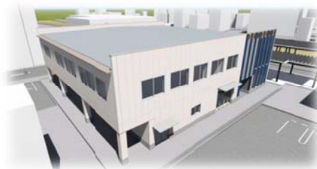
(気仙沼駅前プラザ外観)