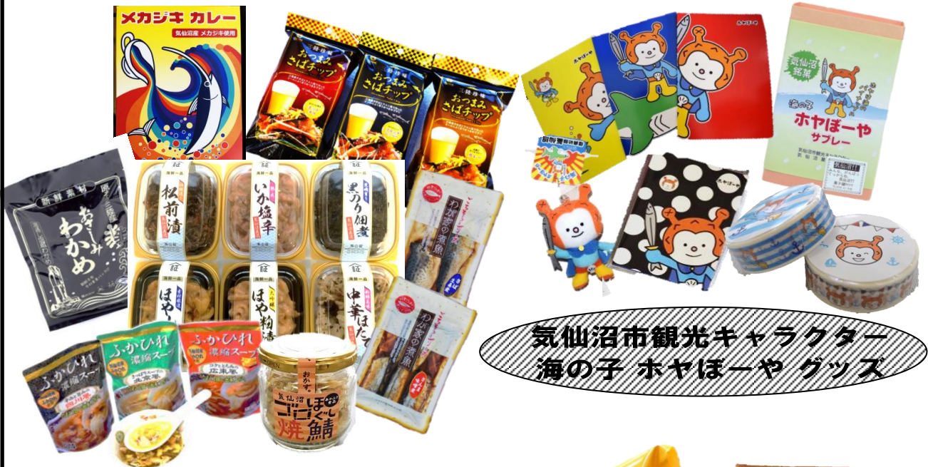
気仙沼市観光キャラクター 海の子 ホヤぼーやグッズ