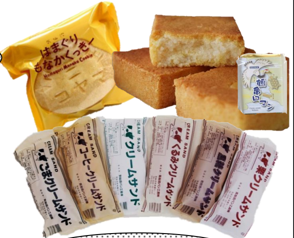
気仙沼市のお菓子 クリームサンド各種

500円以上お買い上げの方、 毎日先着100名様に 「ホヤぼーやマグネット」を プレゼント！ 初日の10日は、ほくも遊びに 行くよ！みんな来てね！