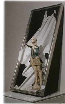
H: 110 / W: 50 / D: 40 (cm)