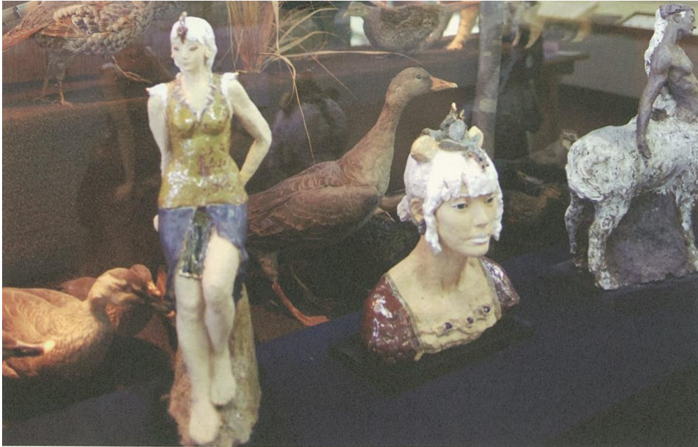
[左] H:52/W:22/D:17, [中央] H:38/W:20/D:31, [右] H:50/W:19/D:36 (cm)