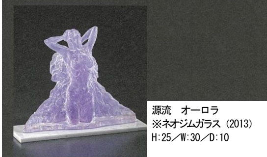
源流 オーロラ ※ネオジムガラス (2013) H:25/W:30/D:10