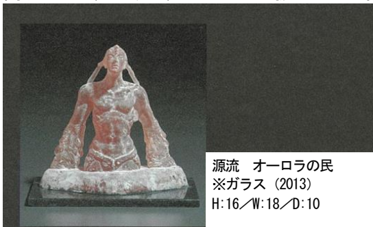
源流 オーロラの民 ※ガラス (2013) H:16/W:18/D:10