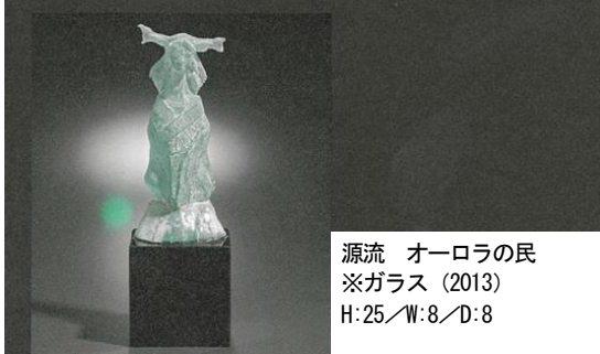
源流 オーロラの民 ※ガラス (2013) H:25/W:8/D:8