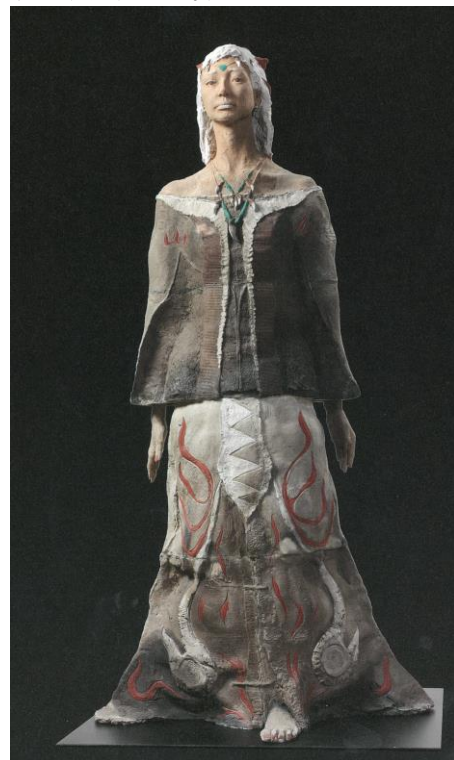
H: 175 / W: 92 / D: 65 (cm)