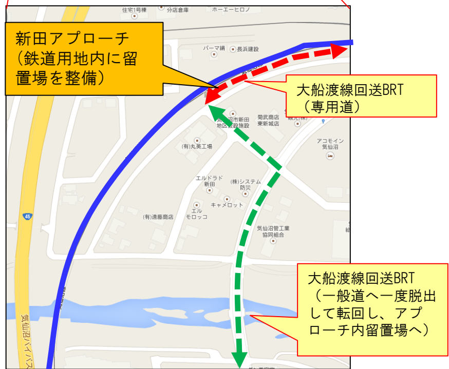
新田アプローチ付近拡大図