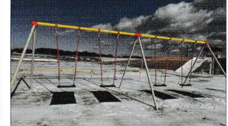
▲ブランコ（北部生コンクリート株式会社より寄付）