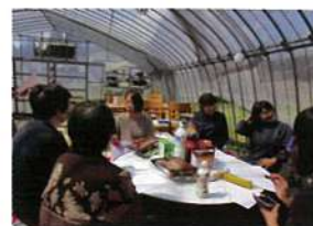
*★令和元年の写真です