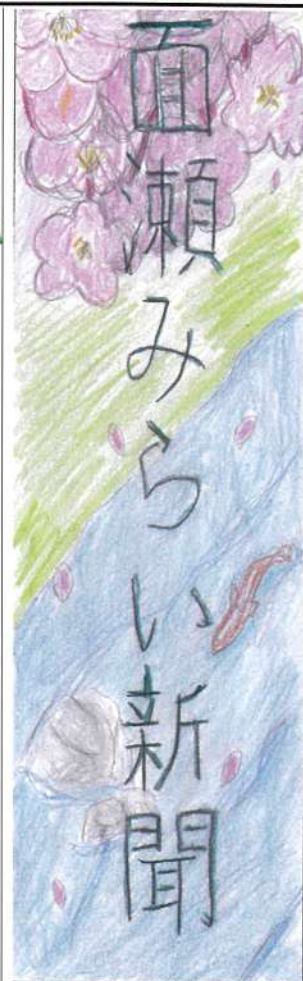
＜面瀬小学校 新入生数＞