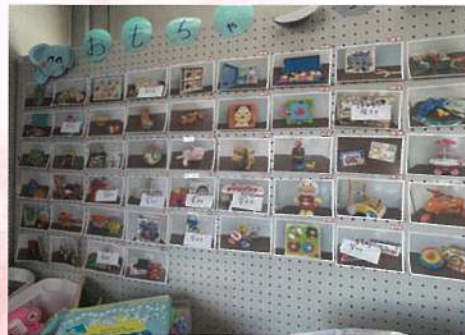
不用品リサイクル活用 「おさがり会」 「おもちゃレンタル」