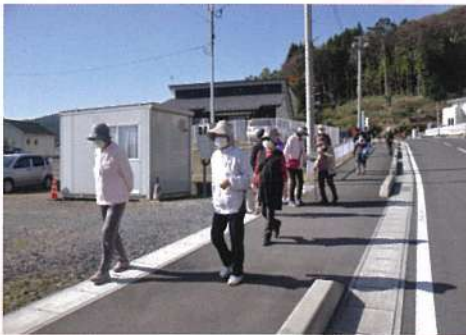
運動不足を楽しく解消したい 「おさんぽすごろく」