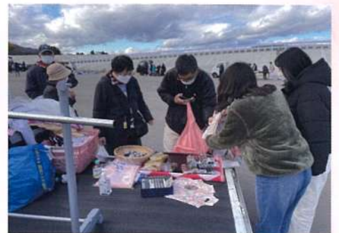
尾崎防災公園の利用促進 「おらほの軽トラ市」