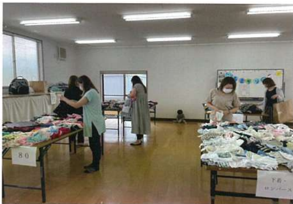
昨年度のおさがり会の様子