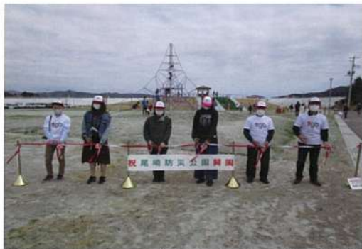
お披露目会の様子 (2021 年 4 月)