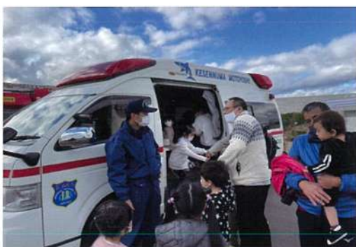
おらほの軽トラ市 (2021 年 11 月)

尾崎防災公園が開園 1 周年を迎えました。子どもたち、のびのび遊べる公園として親しまれています。昨年 2021 年 4 月、コロナ禍のため開園式は行えませんでしたがお披露目を開催しました。5 月には「地区グラウンドゴルフ大会」、8 月には一般社団法人ライトアップニッポンによる「花