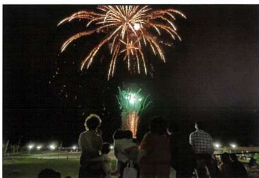
花 火 (2021 年 8 月)