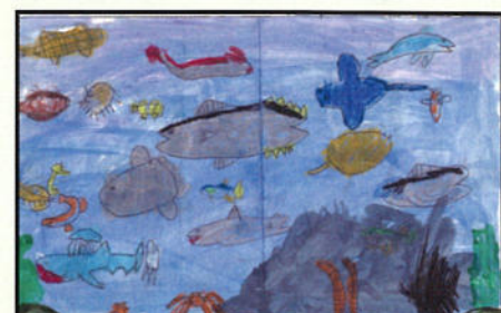
★民生児童委員協議会長賞★