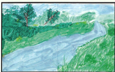
★緑化推進協議会長賞★