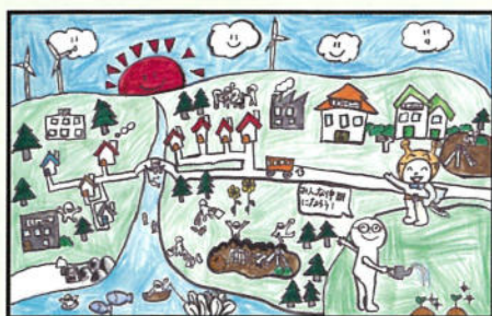
★まちづくり協議会長賞★