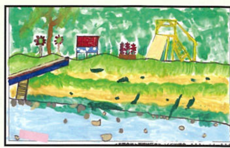
★面瀬川ふれあい農園委員長賞★