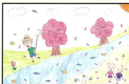
★自治会長連絡協議会長賞★