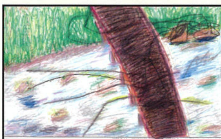
★面瀬地区社会福祉協議会長賞★