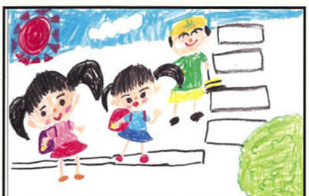
★緑化推進協議会長賞★