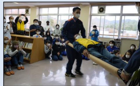
昨年の搬送訓練の様子

鹿折地区自主防災本部は、6月25日(日)午前避難所開設総合訓練を行います。訓練内容は「垂直避難訓練」「避難所開設総合訓練」「備蓄品点検」「搬送訓練」等を予定しております。当日は、地域住民・鹿折中学校・鹿折地区自主防災本部・鹿折まちづくり協議会・技能実習生等が参加予定です。