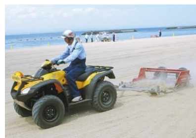
ビーチクリーナーの例

高齢化等に伴う人手不足も懸念されていることから、ビーチクリーナーの導入など省力化を推進する。(ボランティア団体、気仙沼観光コンベンション協会、市(観光課、環境課))