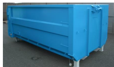
産廃ボックスを活用した例

入網ごみやボランティアによる海中ごみ・漂着ごみの回収を推進するため、漁港等に海ごみ回収ステーションを設置する。市民の意識の高まりに応じて、陸上のポイ捨てごみ回収ステーションも検討する。（漁業者，宮城県漁業協同組合，市（環境課，水産課，循環型社会推進課））