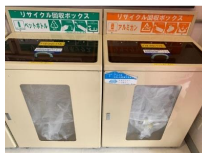
小売店のごみ回収ボックス

一部の小売店では、店頭でペットボトルや食品トレイなどの回収を実施している。消費者からは自宅での保管場所等の問題からこうしたサービスの提供が望まれており、小売店と協力してリサイクルごみの店頭回収を推進する。(市民、事業者、各団体、市(循環型社会推進課))