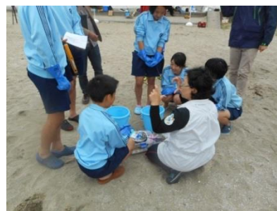
漂着ごみ調査の様子

漂着ごみの調査等により海洋プラスチックごみの現状を理解し、意識の高揚を図るとともに、海水浴場や海岸等の清掃活動を市民全体での取組に発展させていく。(各学校、各団体、市(観光課、環境課))