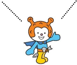
大島歯科診療施設外観 平成 18 年建築