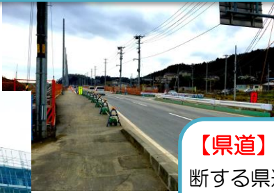
*地図はイメージ図です

【県道】 鹿折を南北に縦断する県道「片浜鹿折線」の一部（北半分）が開通しています。