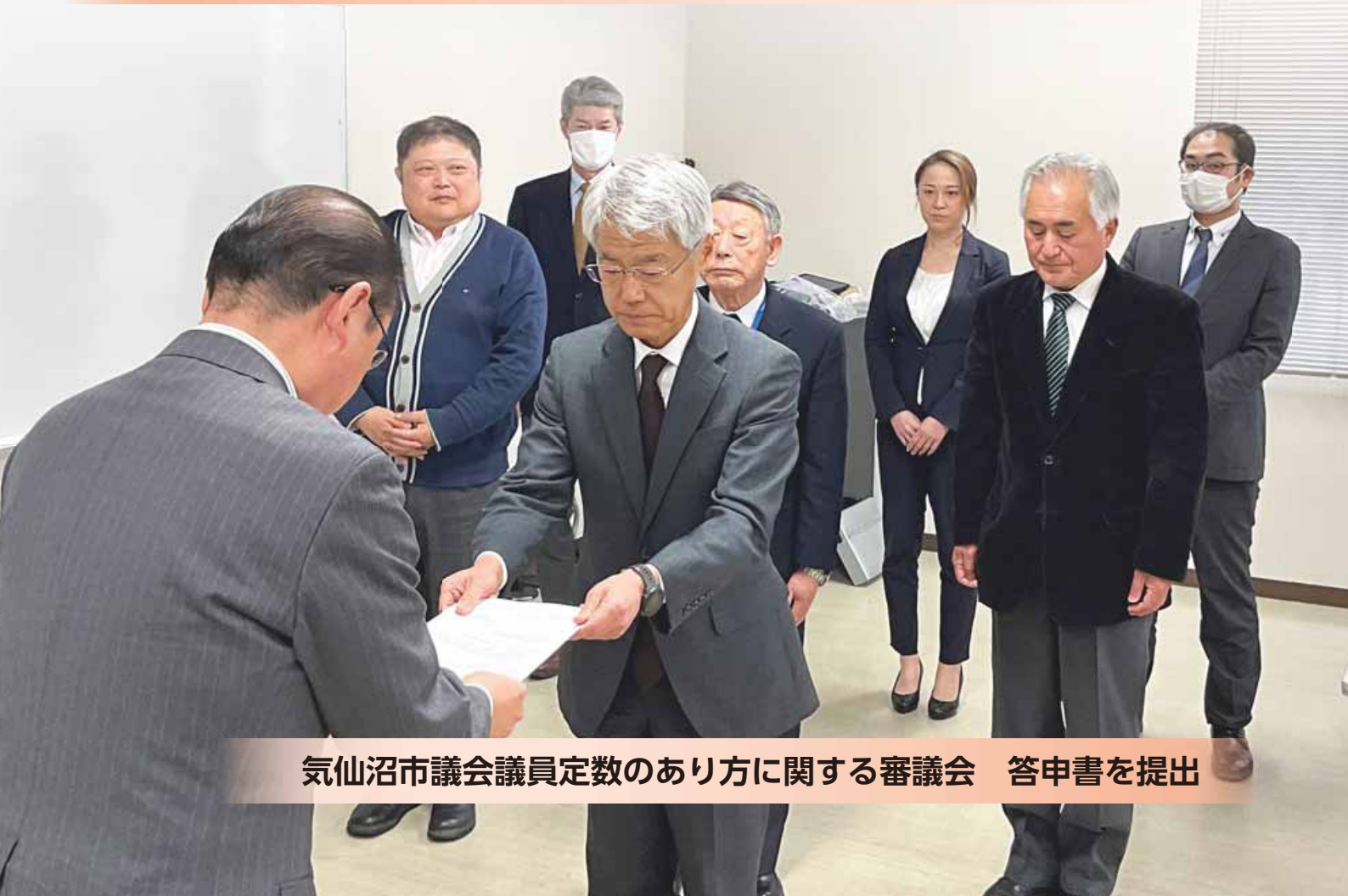
気仙沼市議会議員定数のあり方に関する審議会 答申書を提出