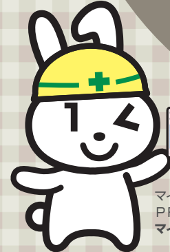
マイナンバーPRキャラクター マイナちゃん